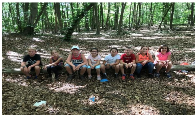
A.L.S.H de Juillet et Août 2020